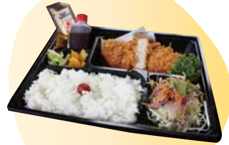
厚切りロースカツ弁当 880円