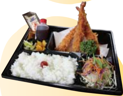
海老フライ弁当 880円